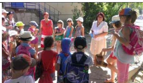
Работаем с детьми