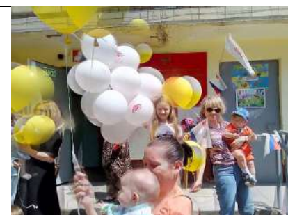
Профсоюз в праздники