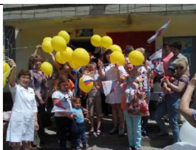
День защиты детей