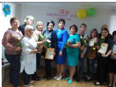
День медицинской сестры