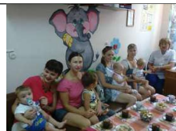
Работаем с мамочками