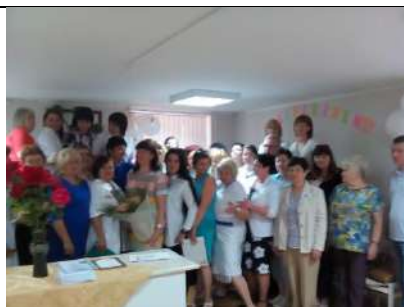
День медицинского работника